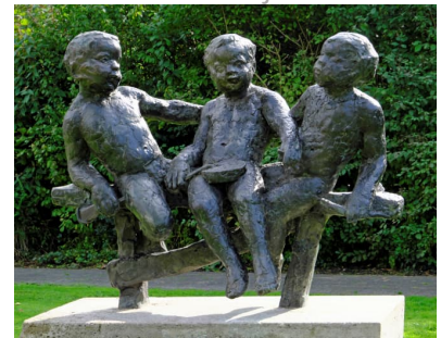
Drie kleine kleutertjes

Naast werken voor bij gemeentebouwen, kocht het bureau culturele zaken ook werken aan die bedoeld waren ter decoratie van nieuw gebouwde wijken. Deze werken werden veelal geplaatst in plantsoenen, parken, waterpartijen en langs wegen en hadden meestal een duidelijke verbinding met de omgeving. Het beeld Sporters van Eric Claus is in opdracht gemaakt als sportbeeld om te kunnen plaatsen in de omgeving van de sportverenigingen. Ook het beeld Judoka's van Pieter de Monchy is aangekocht met het idee een representatief beeld voor de sport neer te zetten. Voor langs het water heeft de gemeente Theo Bennes de opdracht gegeven diverse beelden van watervogels te maken die voorkomen in Nederland. Populaire keuzes voor de decoratie van plantsoenen en parken waren vrouwfiguren (bijv. Baadster en Liggende vrouwenfiguur) en dieren (bijv. Paardentorso en Lama).