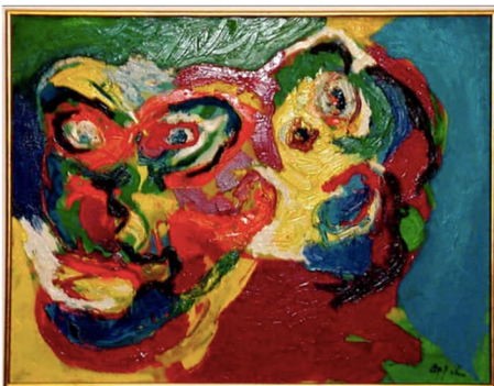
Karel Appel, Deux têtes ensemble, 1966, olieverf op doek.