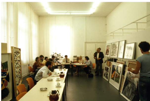
Beoordeling van BKR-kunst.